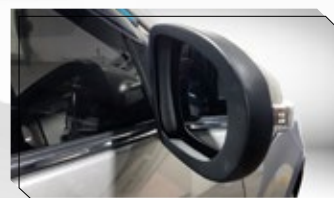
Seguro de espejos