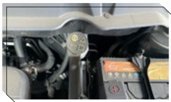
Seguro de computadora