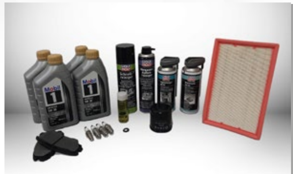
(*) Lubricantes, materiales y repuestos Plan de mantenimiento preventivo DFSK Glory 500.