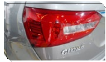
Seguro de faros delanteros y posteriores

Glory te ayuda a sentirte protegido y seguro a donde quiera que vayas, con este kit para tus espejos laterales, la computadora, tus aros, y tus faros delanteros y posteriores.