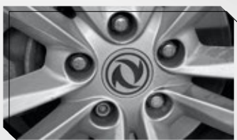
Seguro de aros